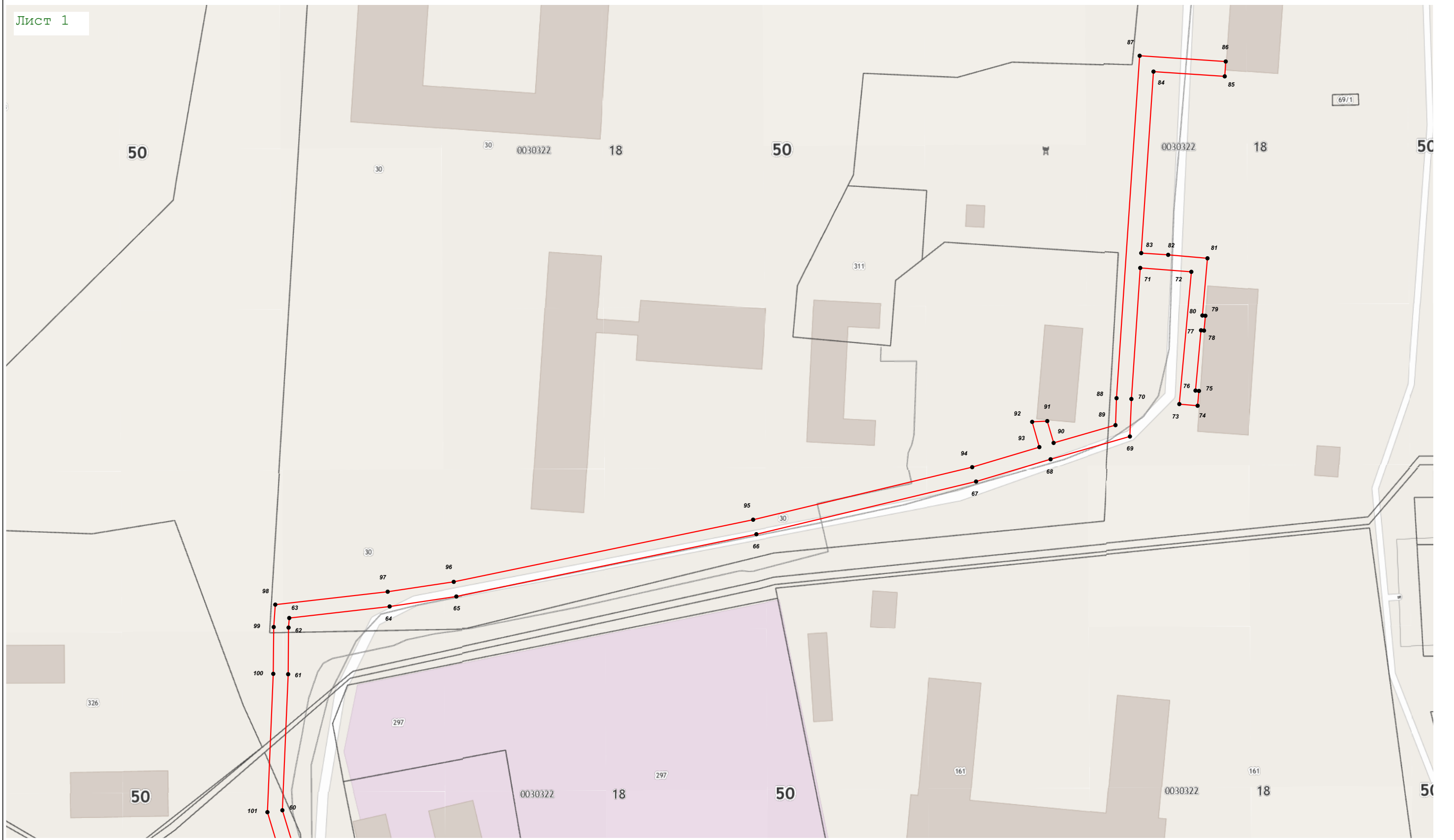
Масштаб 1:1 000