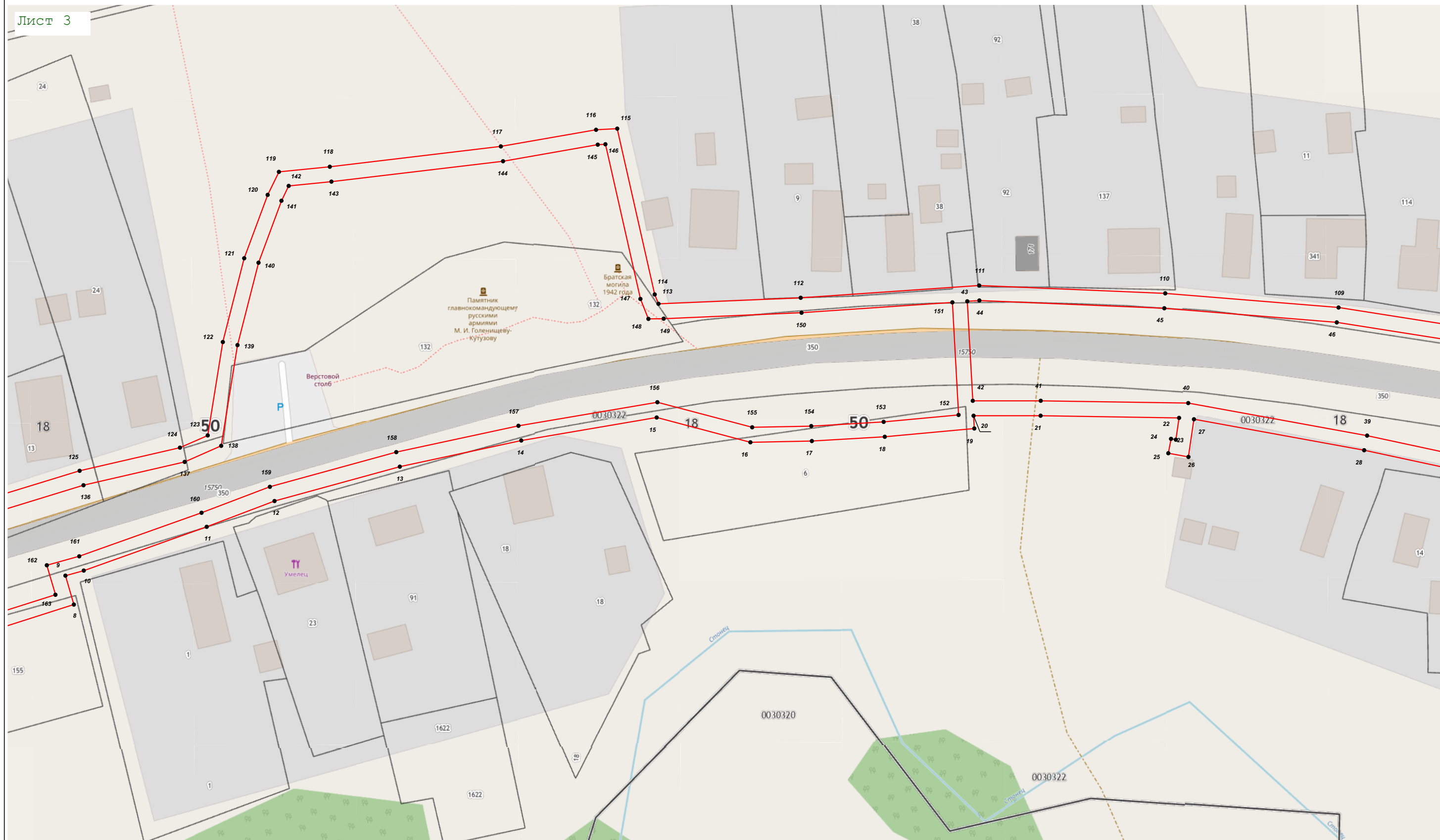
Масштаб 1:1 000