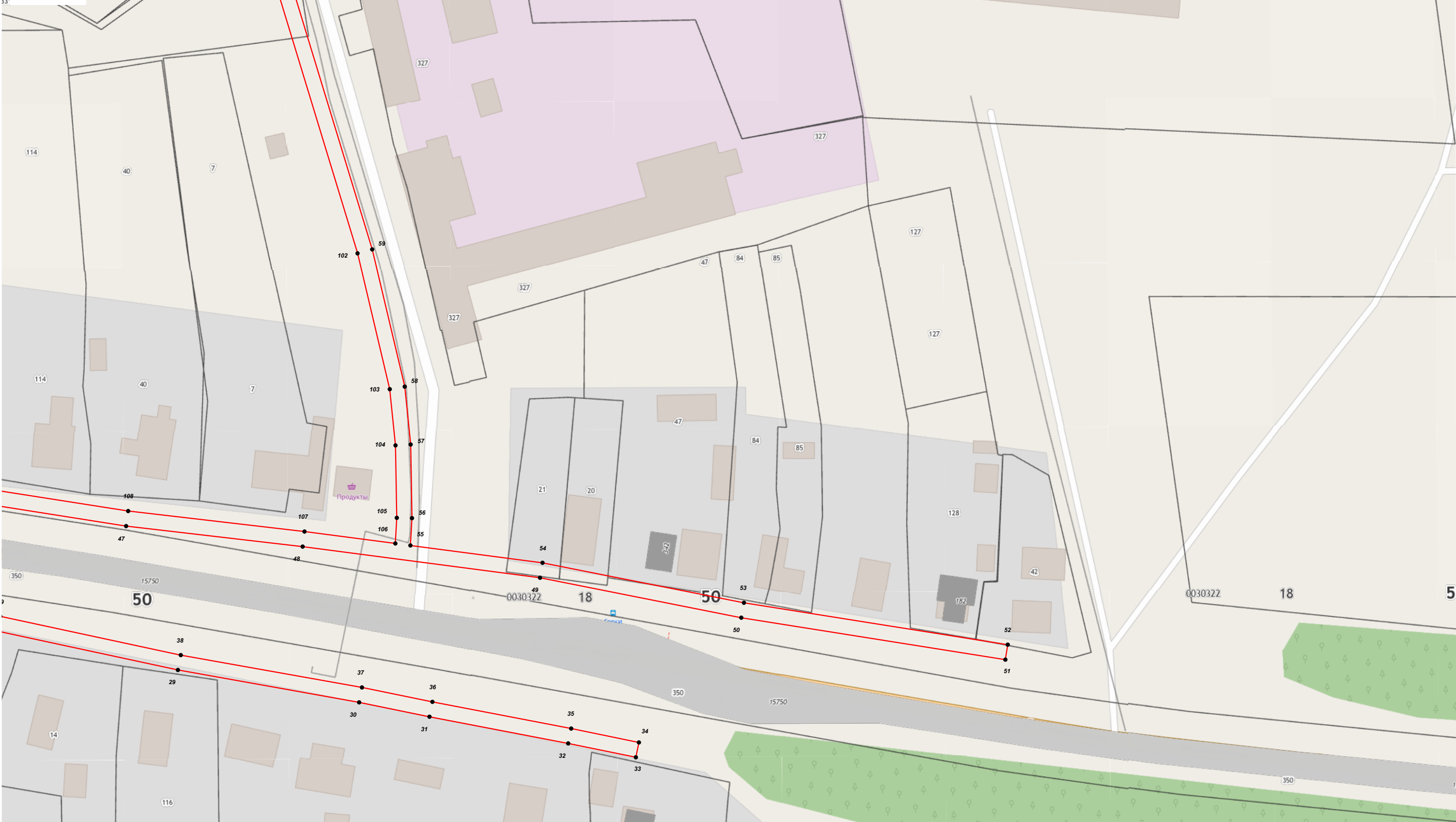
Масштаб 1:1 000