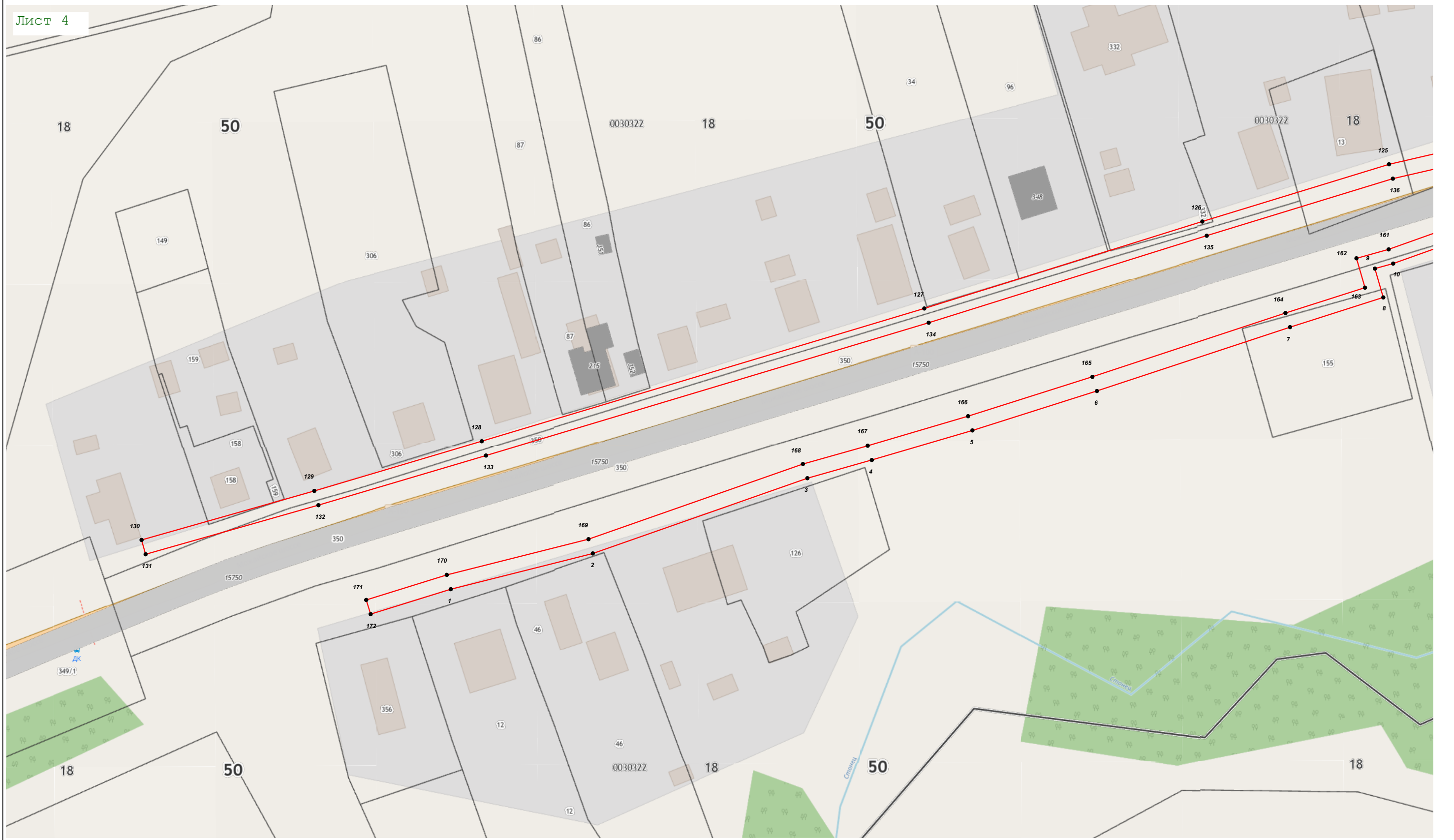
Масштаб 1:1 000